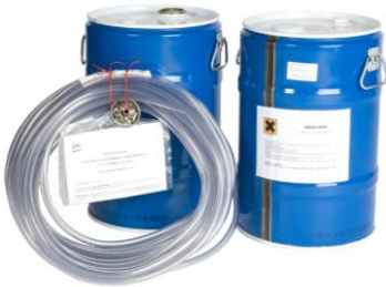
A kép nem szerződéses.